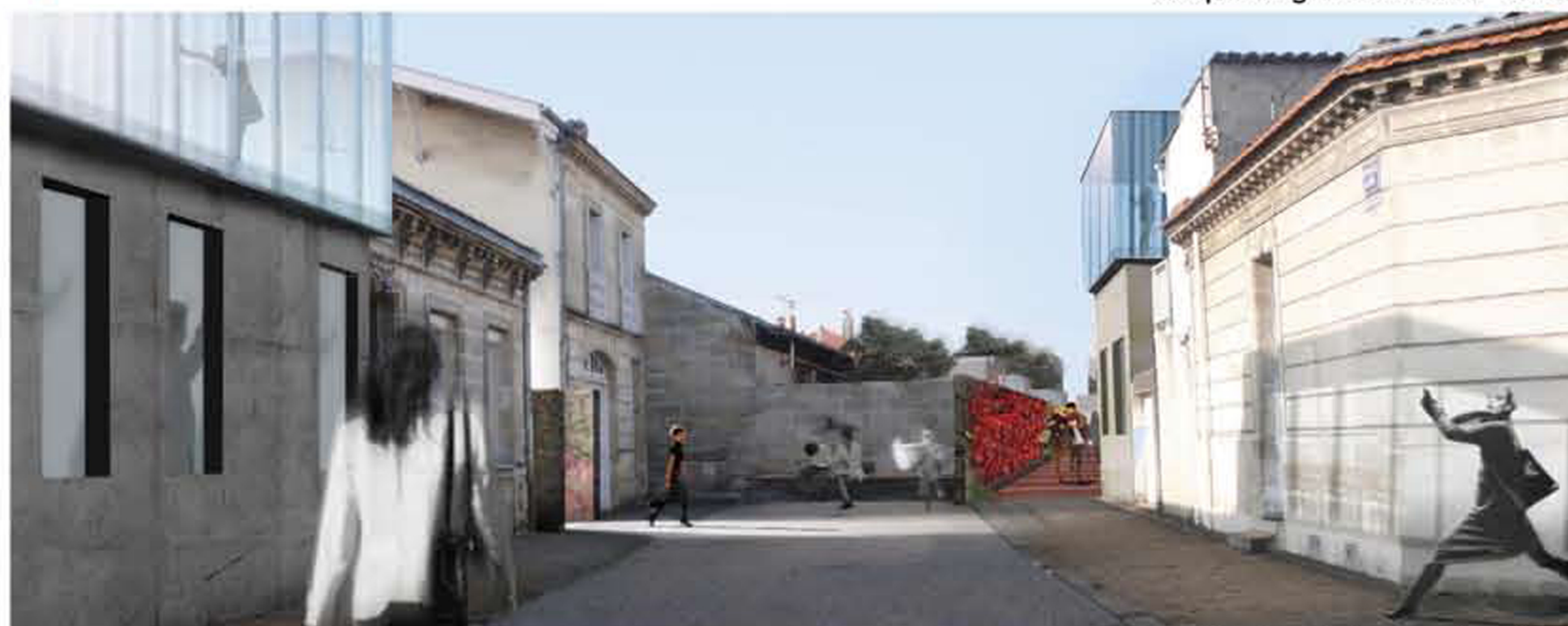
Vue depuis la rue de nérac