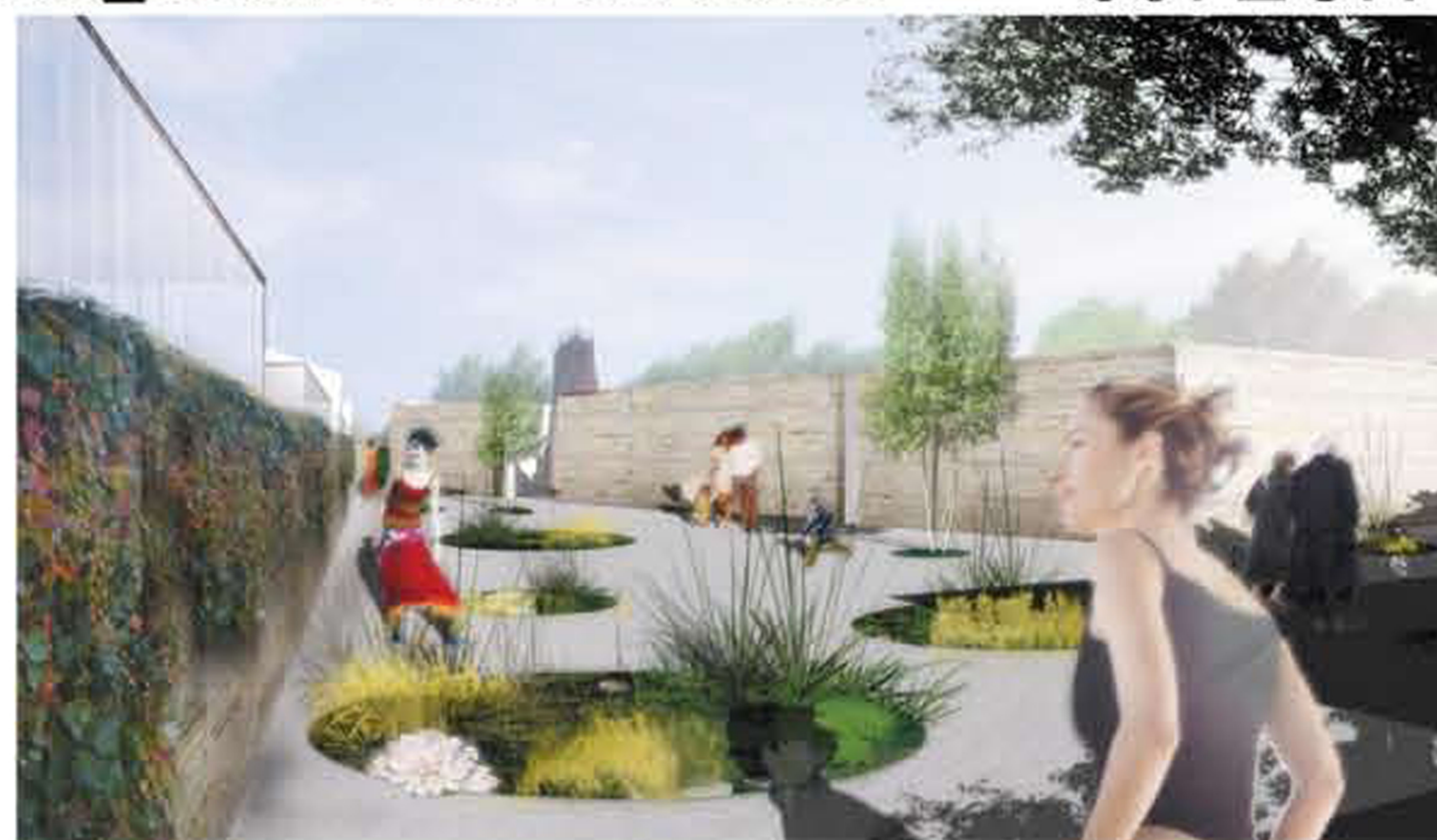
Vue sur le jardin zen