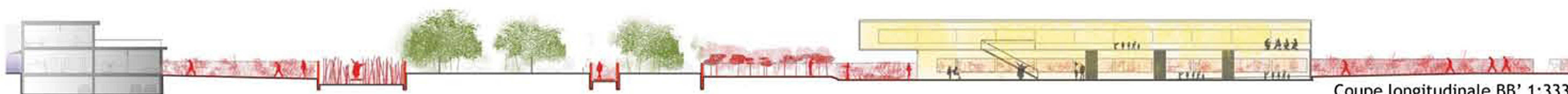
Coupe longitudinale BB' 1:333