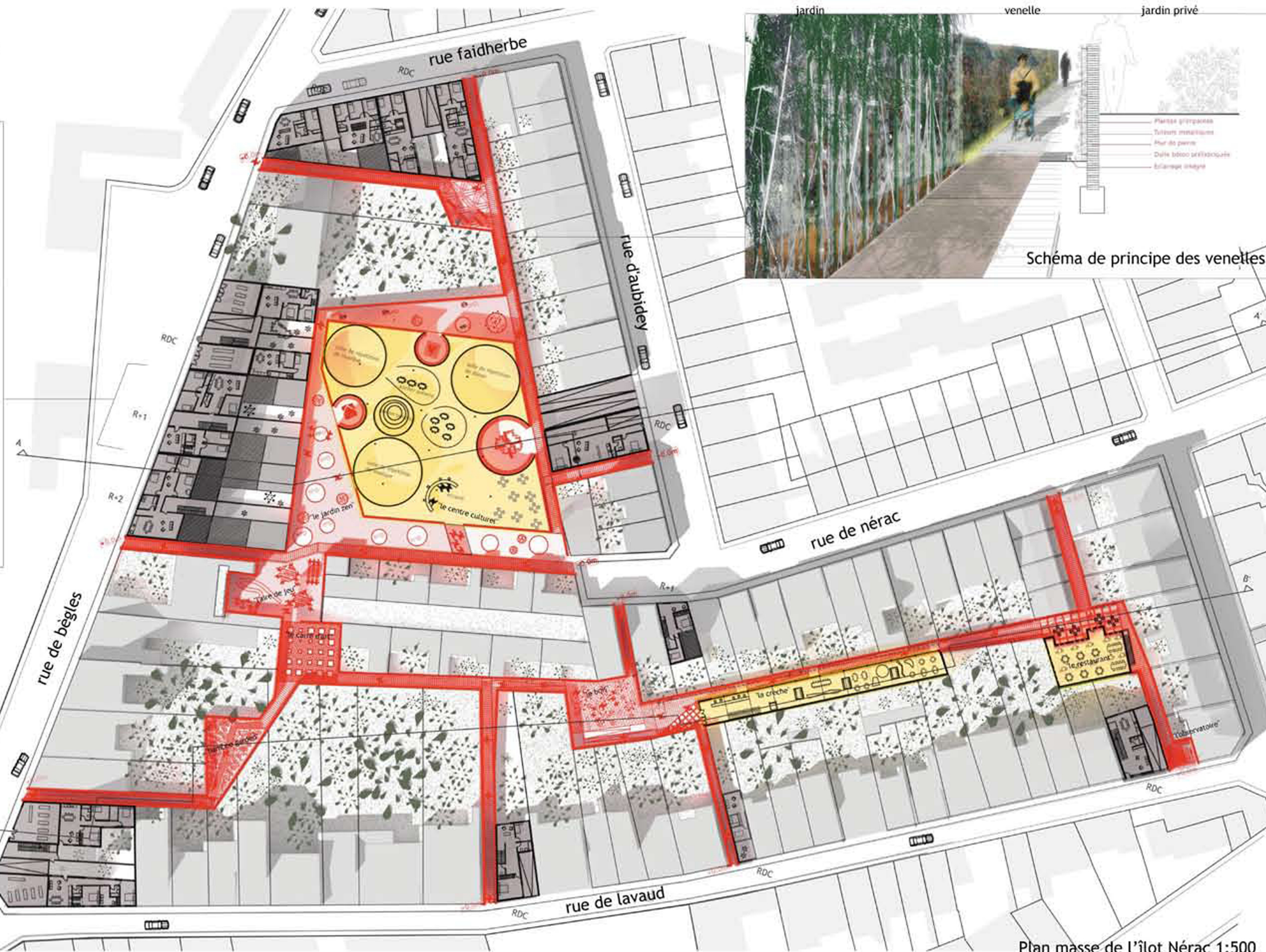
Plan masse de l'îlot Nérac 1:500