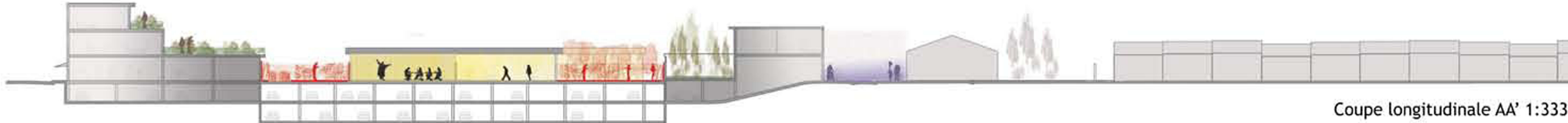
Coupe longitudinale AA' 1:333