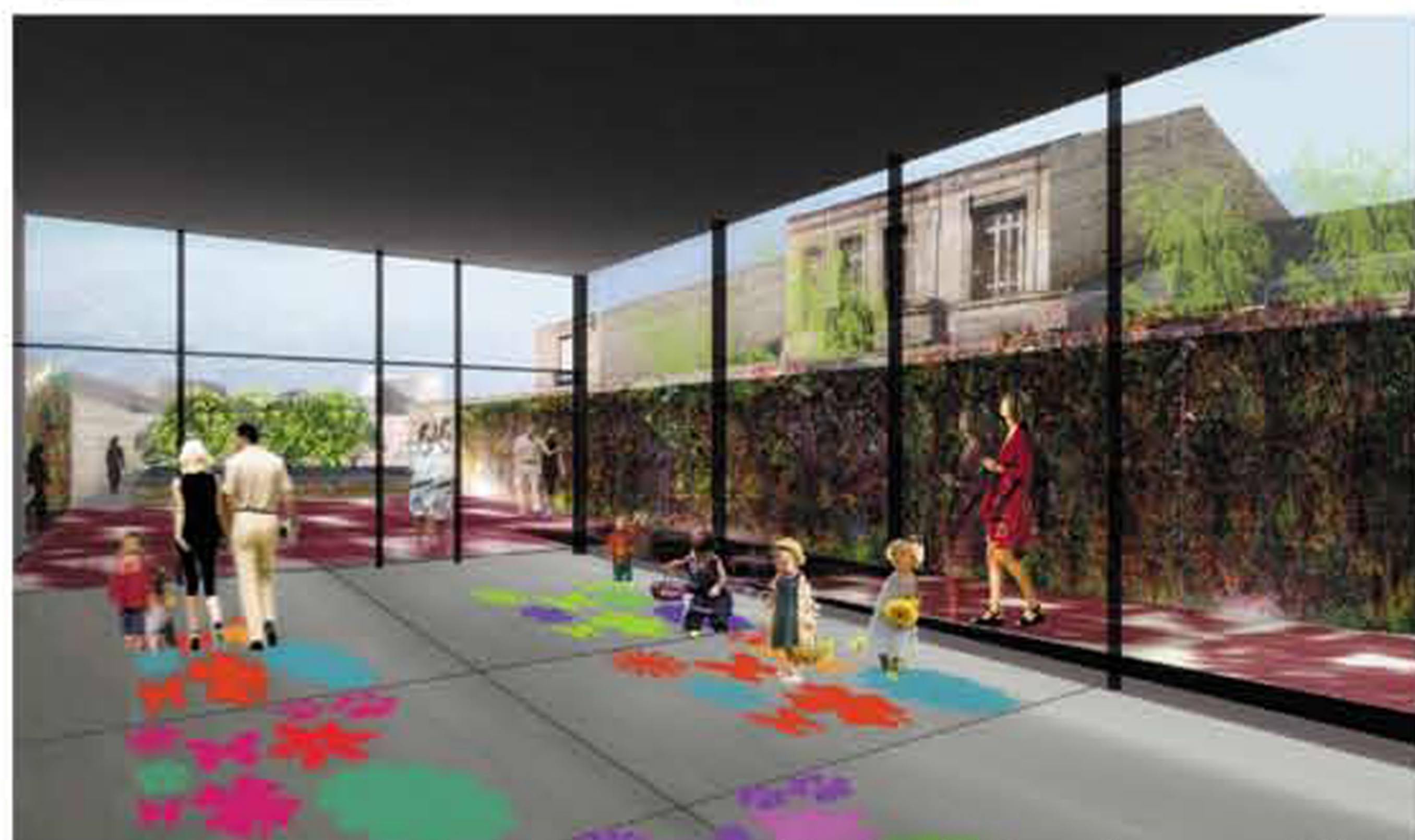
Vue depuis la maison associative