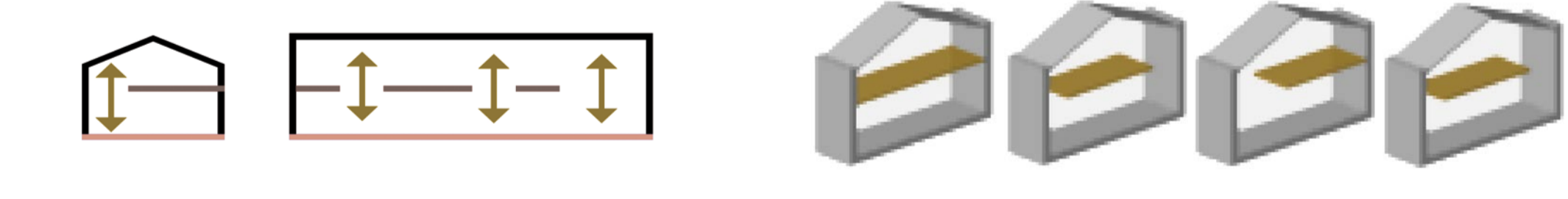
restituer la double hauteur