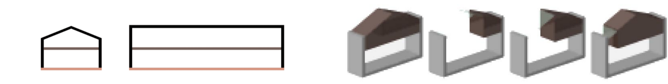
installer des ateliers à l'étage